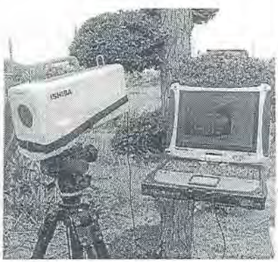
線量の分布を示すガンマカメラ

除染には、とにかく広い仮置き場が必要だ。それが誰にもわかる。ガンマカメラは1台1200万円する。除染を進める上でぜひほしい。4月、購入を国の福島環境再生事務所に申し入れた。しかしまだ回答がない。(山田佳奈)