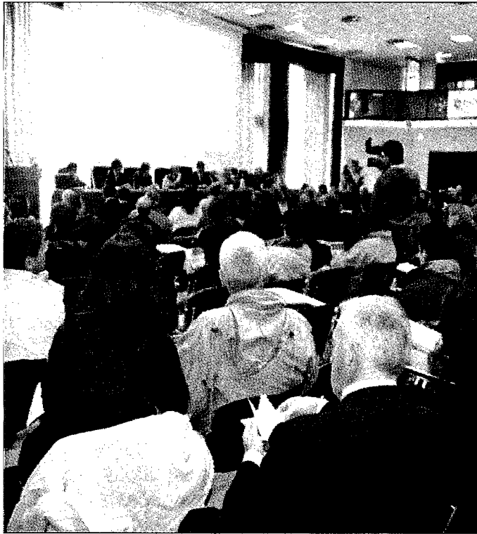
L'incontro dei "cittadini-amministratori" ieri alla Regione Lazio